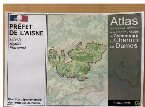
Mini-Atlas de la CC du Chemin des Dames

Comité Local de Cohésion des Territoires