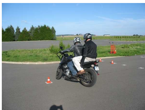
Épreuve hors circulation – Permis moto (Chambry)

Enfin, 249 arrêtés et 1171 avis de transport exceptionnels ont été traités en 2020, de même 35 avis pour travaux routiers sur routes à grande circulation.