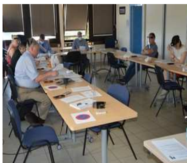
CODIR présentiel partiel (mai 2020)

Les comités de direction (38) ont suivi la même tendance avec des CODIR. Pendant le premier confinement, 17 Codir dématérialisés parfois deux fois par semaine ont permis de partager les décisions adapter la production et la posture de la DDT selon 3 objectifs : 1/ poursuite de nos instructions (Anah, PAC, ADS ...) 2/ appui à la gestion de crise (AEP, Assainissement ...) 3/ projection sur l'avenir (mini Atlas, ...)