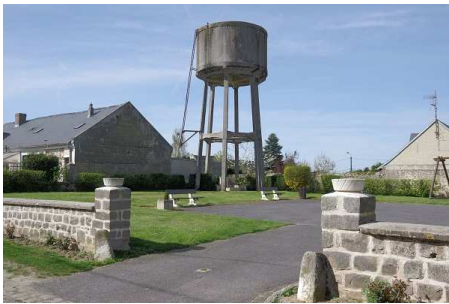
Réservoir à eau (Bucy les Cerny)

Rendus obligatoires, ces PCA (72 eau potable et 28 en assainissement) ont permis la poursuite de l'activité de ces services publics en toute sécurité.