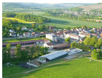
Lycée agricole (Crézancy)