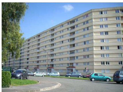
Quartier Europe (Saint-Quentin)