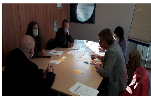
Séminaire des cadres (septembre 2020)