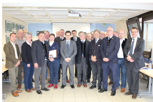
Réunion de la Louveterie 14/02/2020 (Laon)

La DDT est épaulée par les lieutenants de louveterie qui sont les yeux de l'administration sur le terrain dans le domaine de la chasse. En 2020, ce sont 250 interventions qui ont été réalisées, avec une nouveauté : ils ont la possibilité d'intervenir la nuit pour des tirs de sangliers, espèce qui cause le plus de dégâts aux cultures. A noter qu'aux 14 lieutenants existants, viendront s'ajouter 5 renforts en 2021