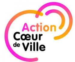
Programmes nationaux Petites Villes de Demain et Action Cœur de ville